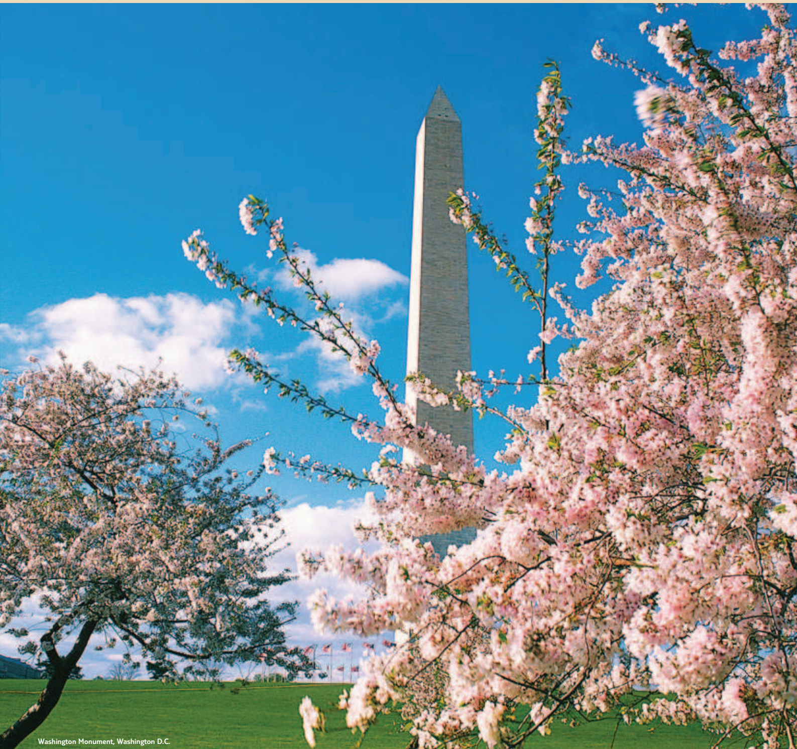
Washington Monument, Washington D.C.