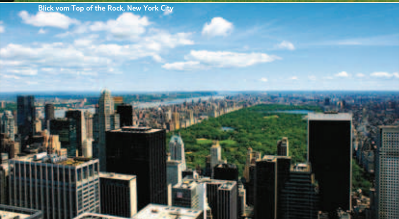
Blick vom Top of the Rock, New York City