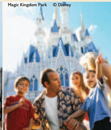
Magic Kingdom Park