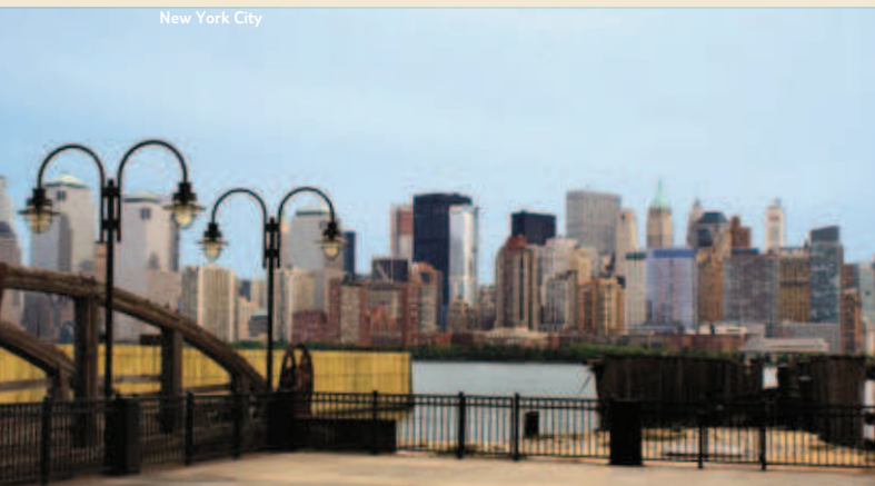
New York City

TUI Individuell: Zubuchbare Transferpakete*: Unbegleiteter Shuttle-Bustransfer vom Flughafen Newark/JFK zum Doubletree Chelsea und Shuttle-Bustransfer vom Rio Florida Beach zum Flughafen Miami EWRXMS30 / JFKXMS30 Pro Person jeweils 39 €. *Buchungshinweis siehe Seite 419.